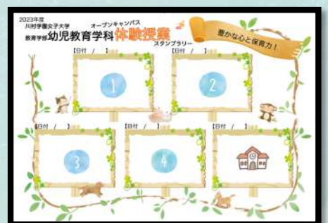
スタンプラリー台紙